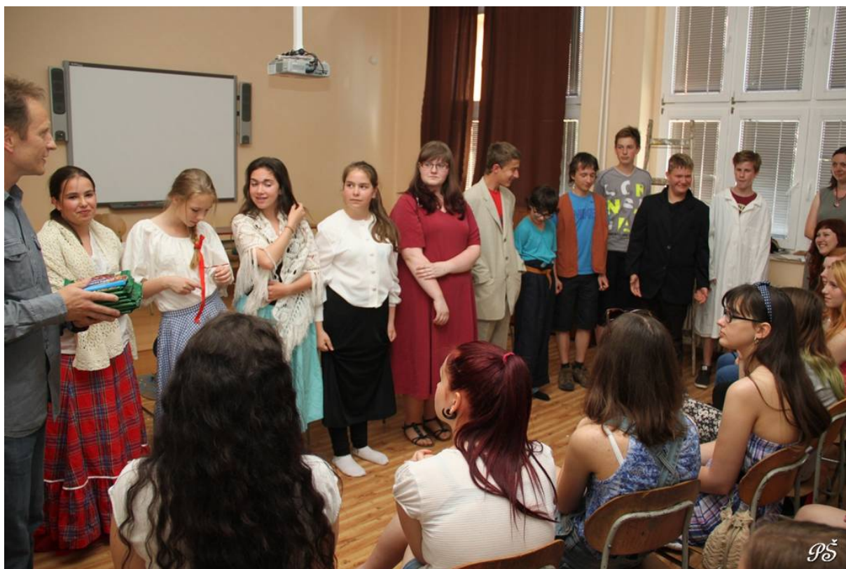
Divadelní představení hry „Tři svatby. Tři vraždy.“ Žákyně a žáci ze ZŠ Dobřany a DDM Planá, Divadelní den 21. 5. 2015.