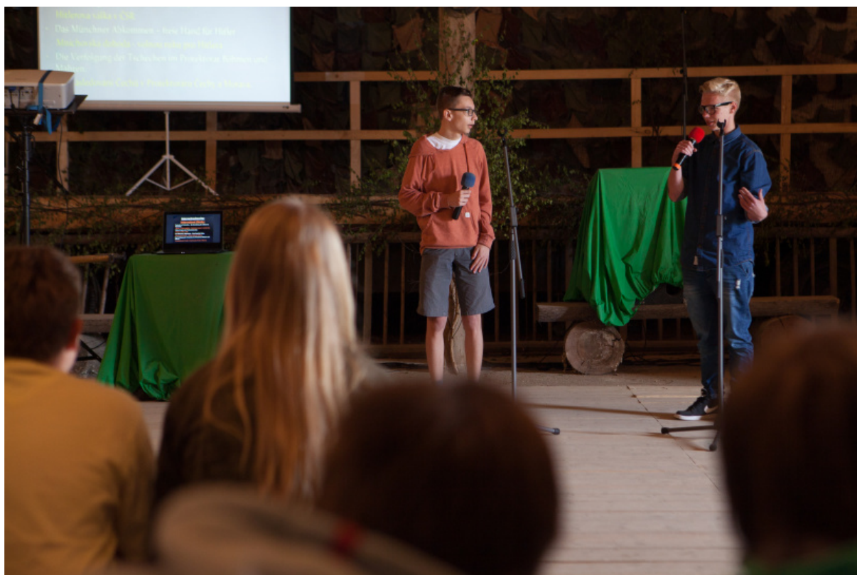
Prezentace výstupů projektu, žáci z JBM Cham, 17. 6. 2015 Krasíkov.