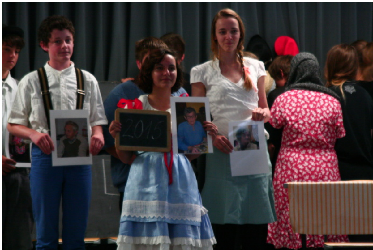
Divadelní představení hry „Vzpomínky“, žákyně žáci ZŠ Chotěšov, Divadelní den 21. 5. 2015.