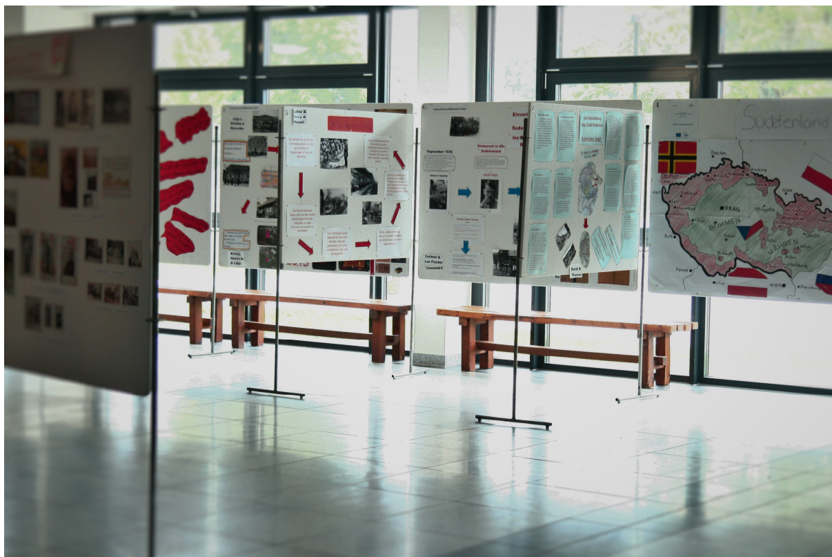
Fotografie z výstavy v rámci divadelního dne 21. 5. 2015 Cham.