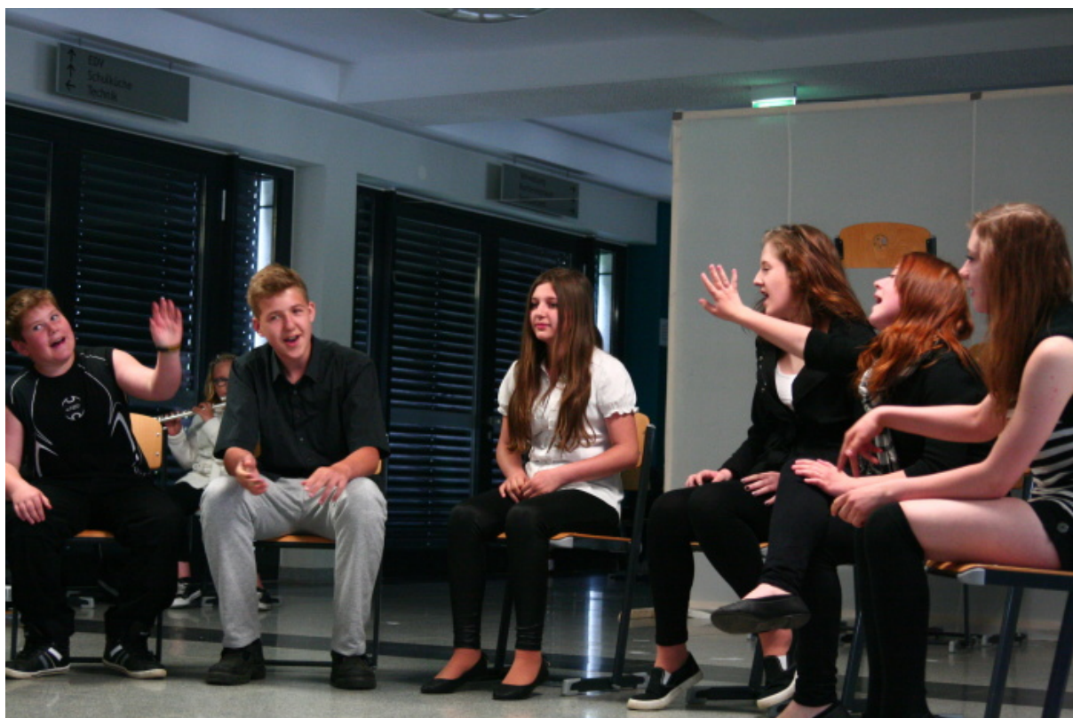
Divadelní představení hry „Přicházení“ žákyně a žáci ze ZŠ Černošín a DDM Planá, Divadelní den 21. 5. 2015.