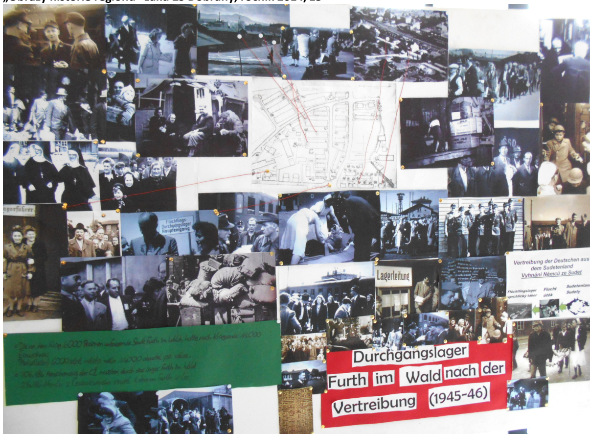
Tablo s fotografiemi zpracované v rámci projektu „Obrazy historie regionu“ Marco Obermeier, Dominik Finzel z JBM Cham, ročník 2014/15