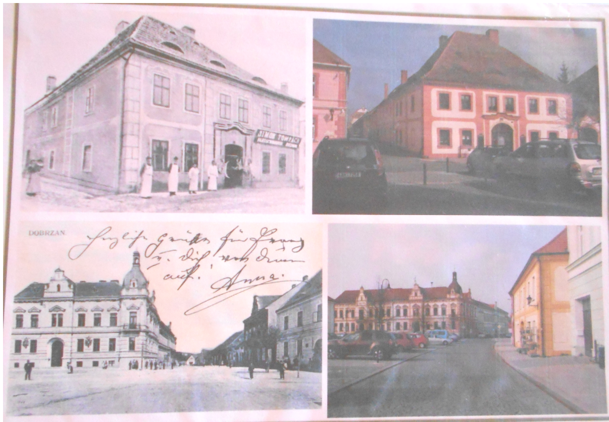
Foto-dvojice a vyhledávání míst odkud byly snímky pořízeny ve městě Dobruška.